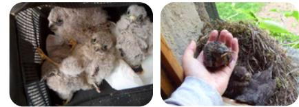
RÉINTRODUCTIONS PAR REMISES AU NID

Repérer les allers-retours des parents et écouter les cris des jeunes.